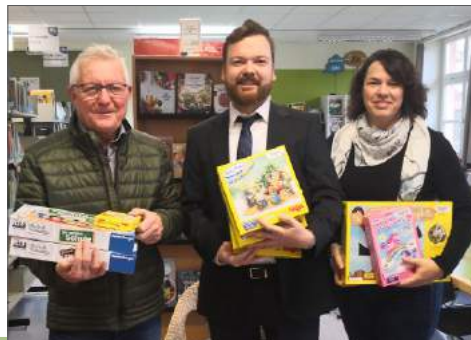
Volksbank Rohr i.NB