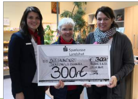
Sparkasse Rohr i.NB